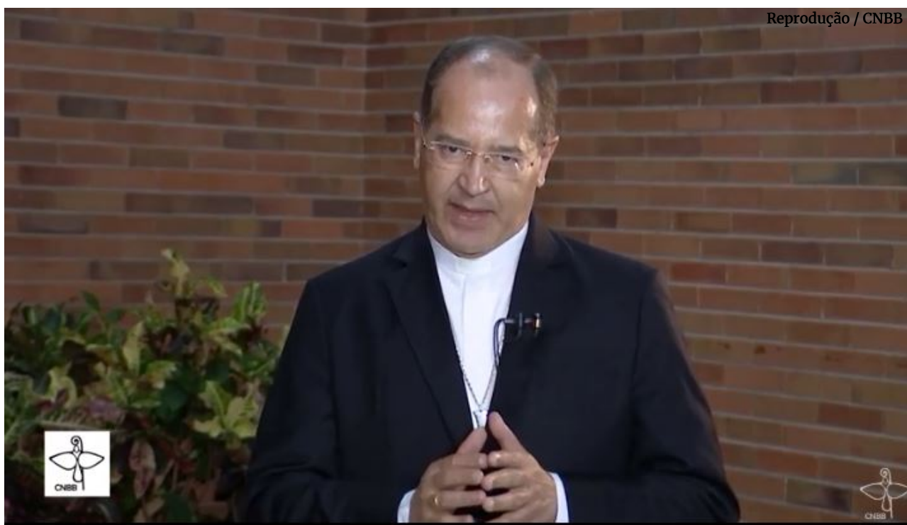
Presidente da CNBB, Dom Walmor Oliveira de Azevedo

A Conferência Nacional dos Bispos do Brasil (CNBB) classificou como injustificáveis e desumanos os vetos do presidente Jair Bolsonaro ao sancionar o Plano Emergencial para Enfrentamento à covid-19 nos territórios Indígenas, comunidades quilombolas e tradicionais (PL) 1142/2020.