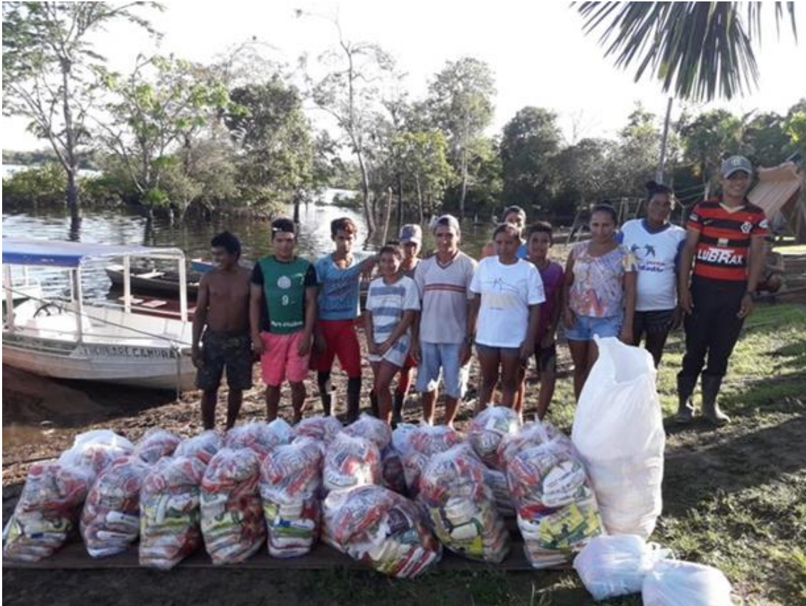
Foto: Doações entregues para comunidade ribeirinha na Reserva de Desenvolvimento Sustentável Amanã - Julho 2020

Nossa campanha Ajuda Amazônia @ajudaamazonia distribuiu 16 toneladas de comida, milhares de máscaras e de kits de produtos de limpeza para centenas de famílias da cidade de Tefé, comunidades ribeirinhas e indígenas da região. Trabalhamos em parceria com grupos e associações locais que puderam destinar as doações para as famílias mais vulneráveis.